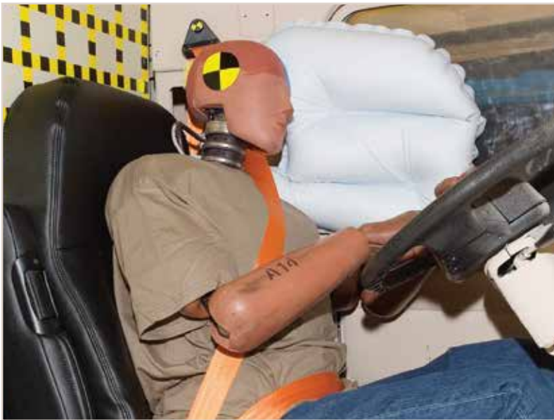
IMMI prueba el sistema RollTek en un equipo para volcadura a 90° en su centro CAPE®.

IMMI comprende que los accidentes pueden suceder en las carreteras o cerca de casa. Durante el viaje, descansando, o aún en la mitad de una volcadura, nuestros sistemas de seguridad están diseñados para reducir las lesiones, y darle al conductor una mejor oportunidad de salir ileso de cualquier accidente, desde alcances menores de defensa a defensa hasta accidentes frontales o volcaduras más severos.